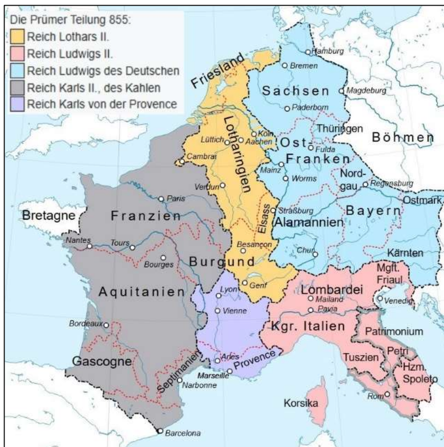
Lotharingen inmitten der Frankenreiche nach Reichsteilung von Prüm 855