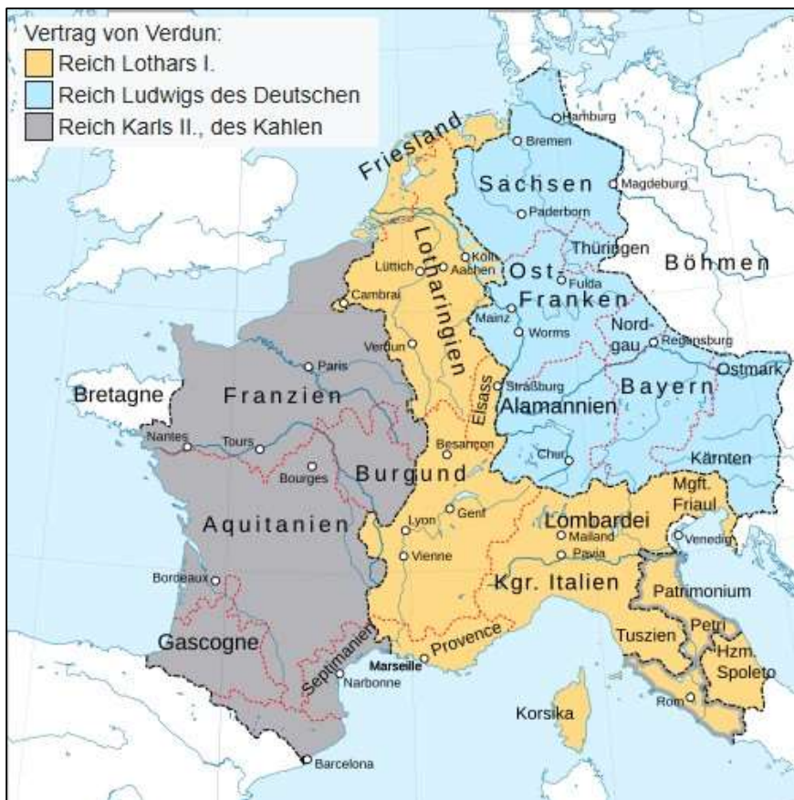
Westfranken, Mittelreich und Ostfranken nach dem Vertrag von Verdun 843